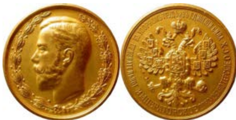
Ил. 9. Золотая (бронза позолота) медаль 43