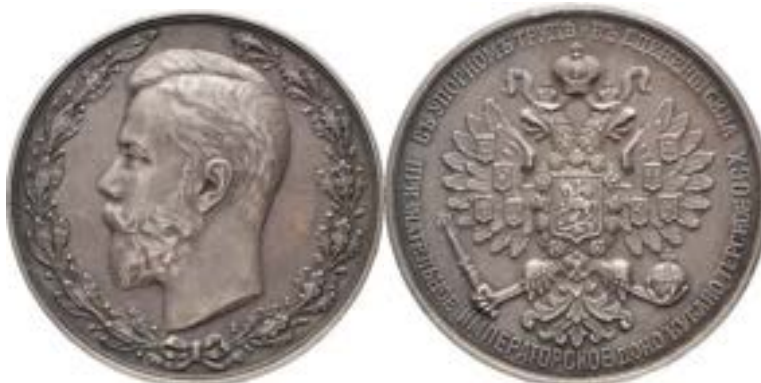
Ил. 10 Серебряная медаль 44

На аверсе в венке профильный портрет Императора Николая II, обращенный влево.