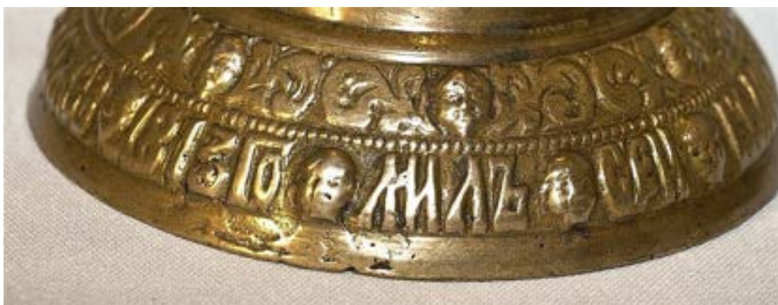
Иллюстрация 45 Фрагмент колокольчика П. Кожевникова. Фотография А. Глушецкого колокольчика из его коллекции.