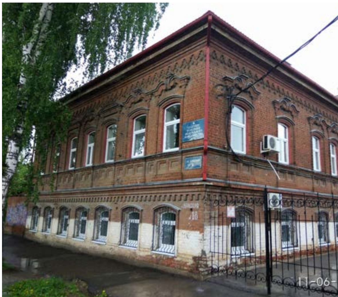
Иллюстрация 28 Дом Кожевниковых в Кунгуре. 2017 г.