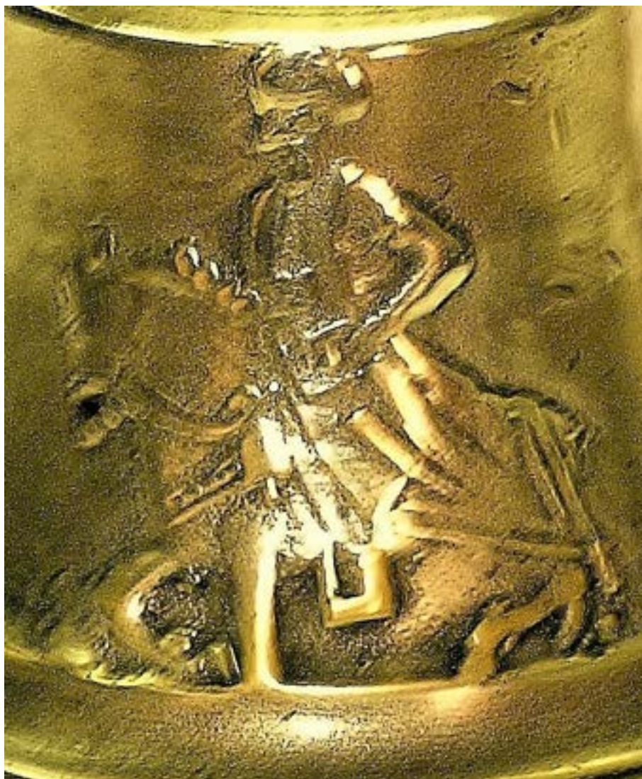
Иллюстрация 50 Фрагмент колокольчика П. Кожевникова. Фотография А. Глушецкого колокольчика из его коллекции.

Ф–классическая, Д–109, В–76, У–18, П–кованная, круглая. На тулове три всадника в чалме без оружия, скачущие влево. Фотография А. Глушецкого колокольчика из его коллекции.