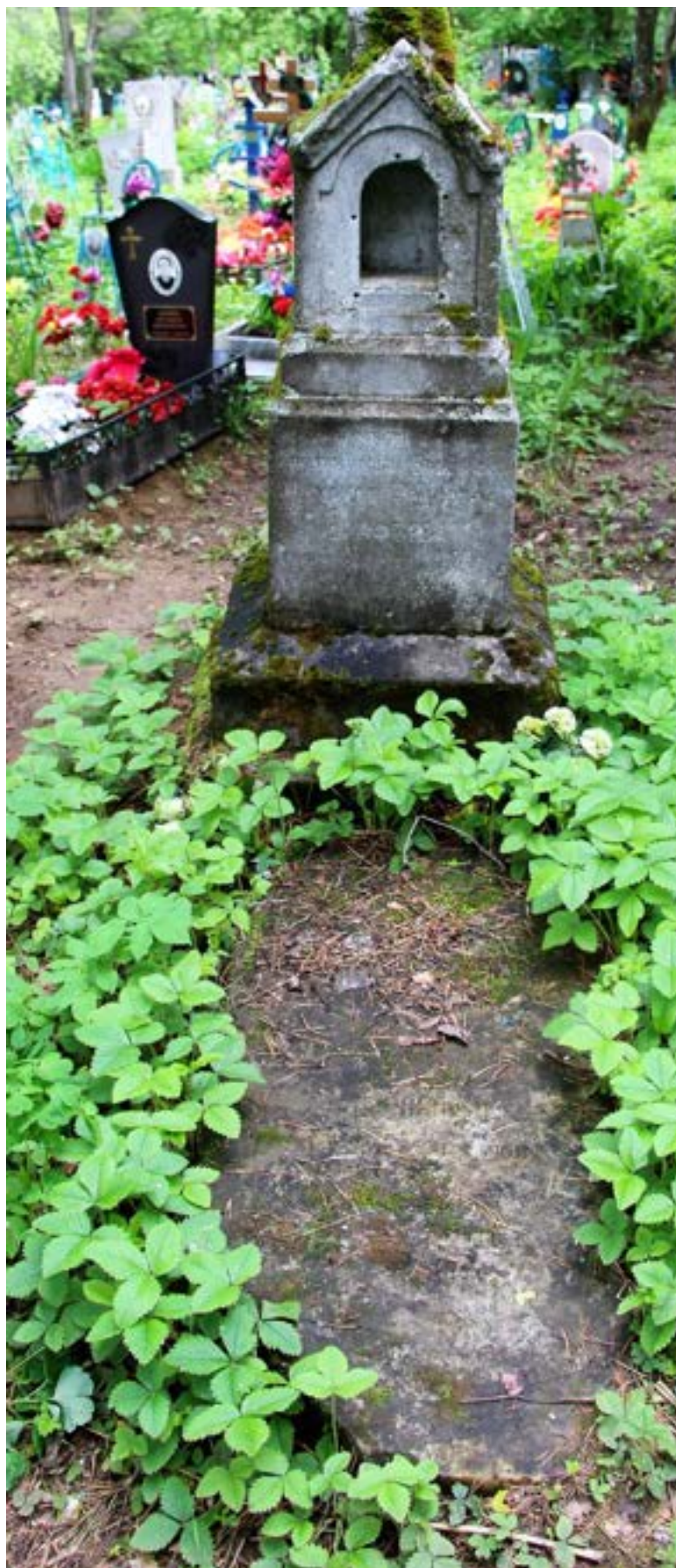
Иллюстрация 20 Могила М.Ф. Ерофеева на кладбище в Суксуне.