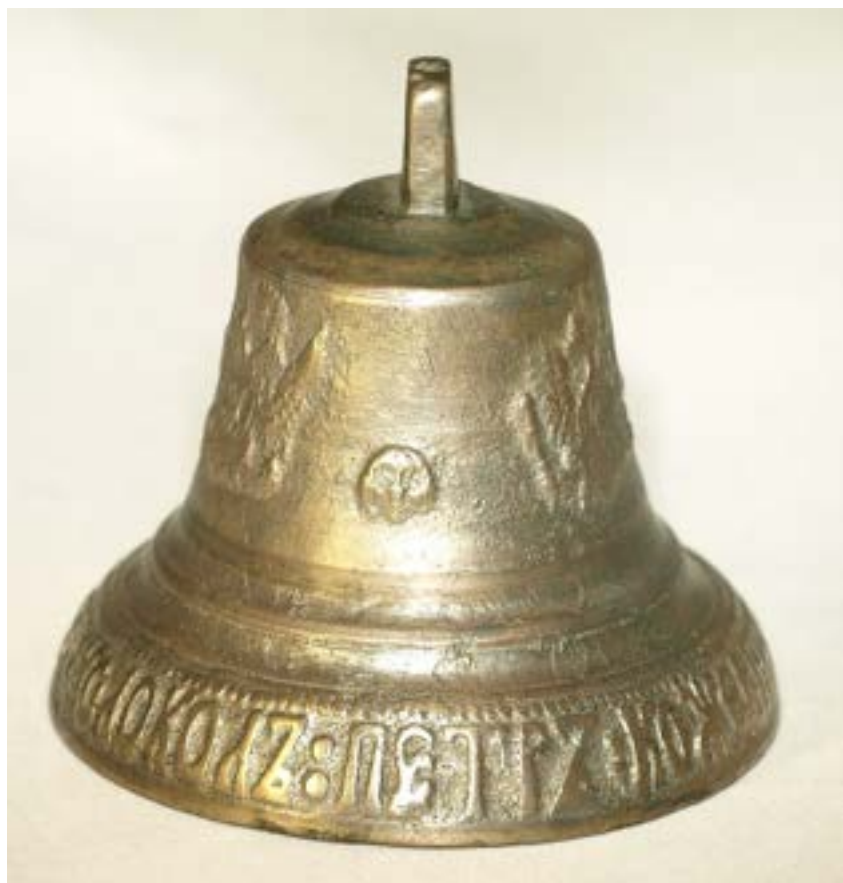
Иллюстрация 47 Колокольчик П. Кожевникова. Фотография А. Глушецкого колокольчика из его коллекции.