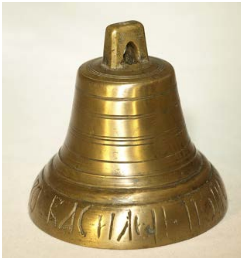
Иллюстрация 27 Поддужный колокольчик В. Попова. Фотография А. Глушецкого колокольчика из его коллекции.