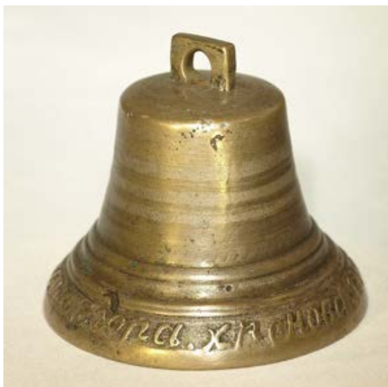
Иллюстрация 6 Колокольчик Е. Хренова: