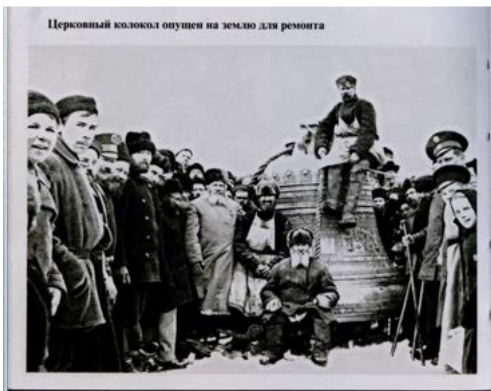
Иллюстрация 68 Колокол в ремонт