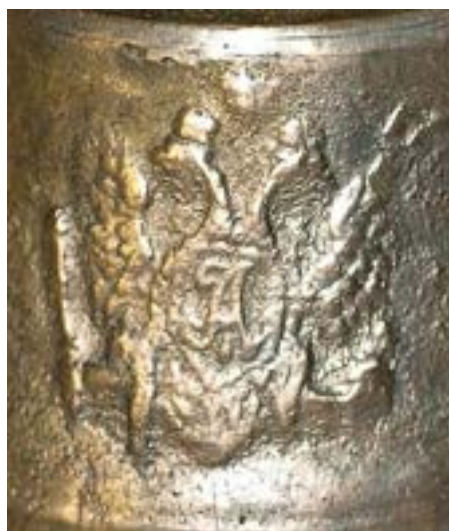
Иллюстрация 48 Фрагмент колокольчика П. Кожевникова. Фотография А. Глушецкого колокольчика из его коллекции.