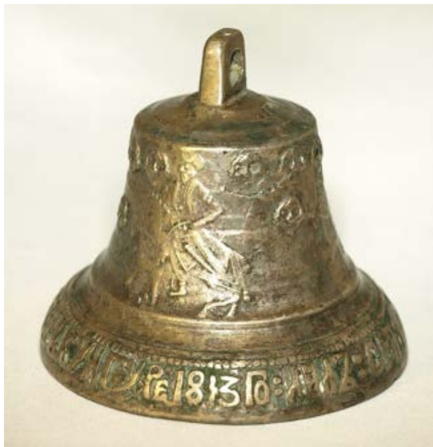
Иллюстрация 33 Колокольчик П. Кожевникова:

..... «1813:Го:ЛИЛЬ:СЕИ:КОЛОКОЛЬ:ПЕТРЪ:КОЖЕВНИКОВЪ:ВЪ КУНГУРЕ»