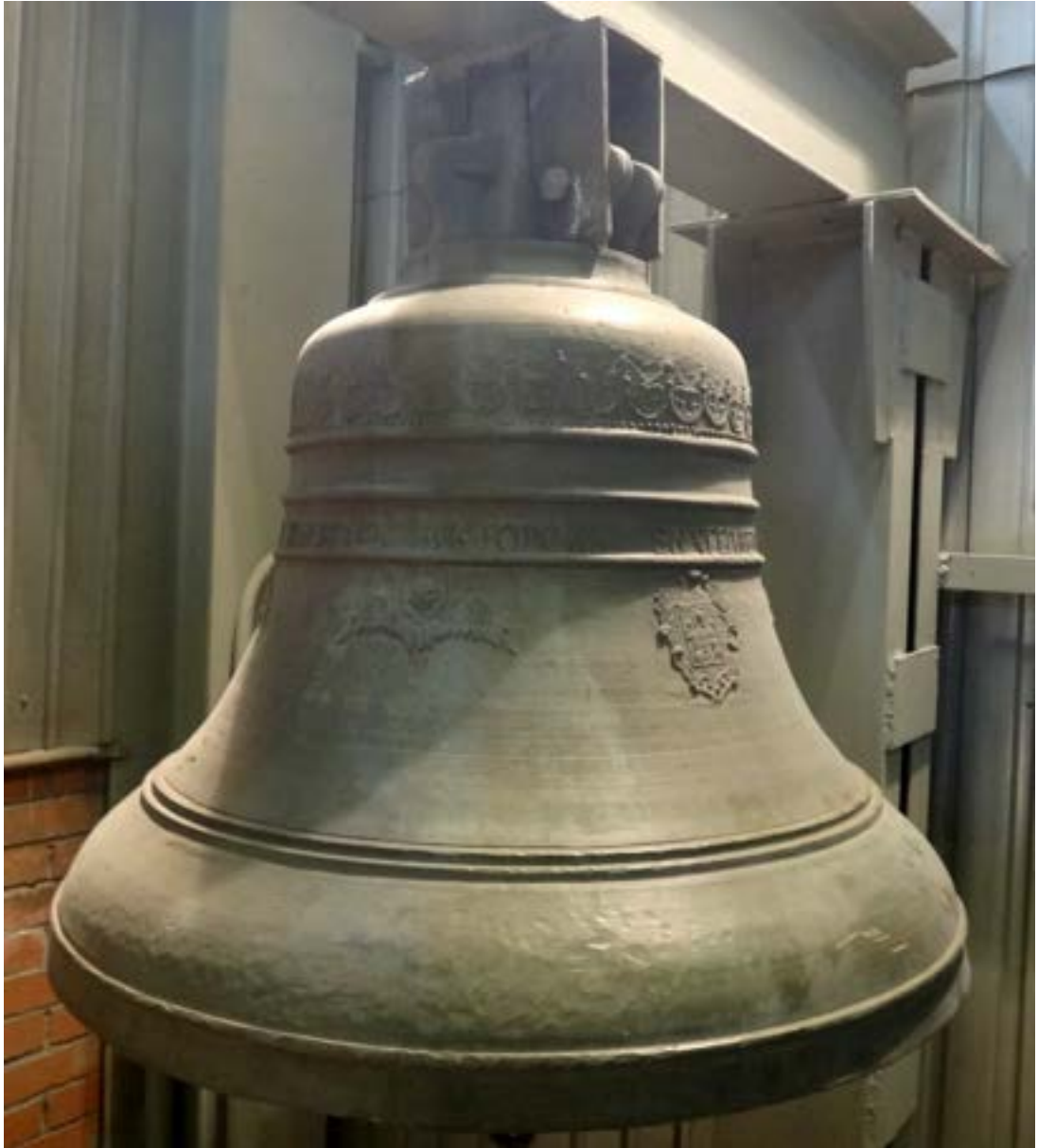
Иллюстрация 9 Колокол Тет Питера из коллекции завода Н. Пяткова, г. Каменск Уральск.