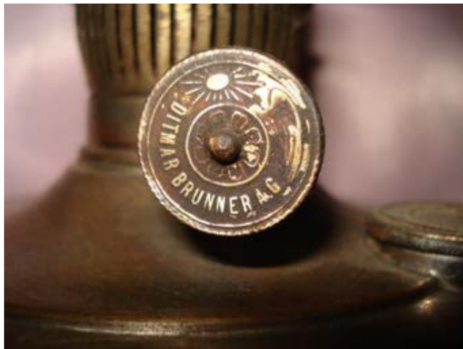
Иллюстрация 5 Фрагмент керосиновой лампы с ручкой регулировки горелки.