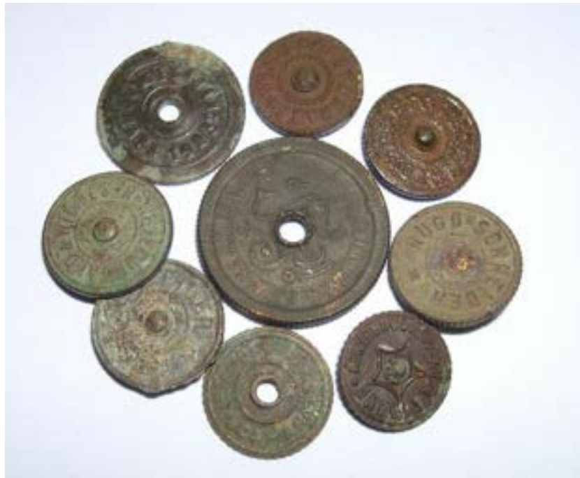
Иллюстрация 4 Торцы ручек регулировки горелок керосиновых ламп.